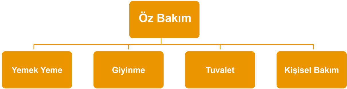
Şekil 1. Öz Bakım Becerileri

eğitim hizmetlerinin temel amacı bu bireylerin bağımsız yaşama katılımlarını desteklemektir. Bağımsız yaşam bireyin başkalarına bağımlı olmadan yaşamını sürdürebilmesi anlamına gelmektedir. OSB (+zihin engelli) sahip bireylerin diğerlerine bağımlı olmadan yaşamlarını sürdürebilmelerini sağlayacak temel becerilerden biri öz bakım becerileridir. Öz bakım becerileri bireyin kişisel bakımını yapabilmesi için gereksinim duyduğu temel becerileri içerir. Bu beceriler Şekil 1'deki gibi sıralanabilir.